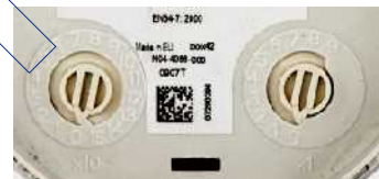
1. ábra: cím beállítása

(A műszaki leírás készítésekor forgalomban lévő központok esetében a beállított címnek 1 – 99 között kell lennie, a 100 – 159 közötti címtartomány csak az új Advanced Protocol-os központokkal használható majd ki.)