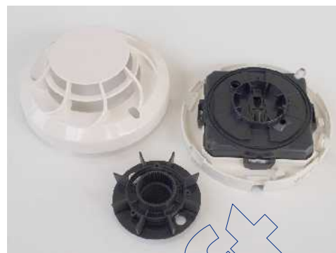
4. ábra: A szétszerelt érzékelő

Figyelem: A sikeresen megtisztított érzékelőnél a PW4 érték néhány perc működé(!) után áll vissza a 800 körüli értékre. Ha ez nem történne meg, vagy az érzékelő továbbra is valamilyen hibát („Szennyezett érzékelő”, „Sürgős karbantartás” vagy „Alacsony kamraérték”) jelez, cseréljük ki az érzékelőt.