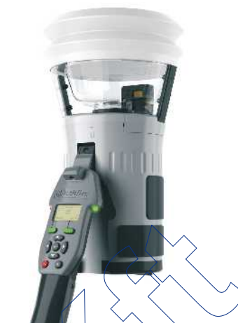
3. ábra: testifire® ellenőrző fej