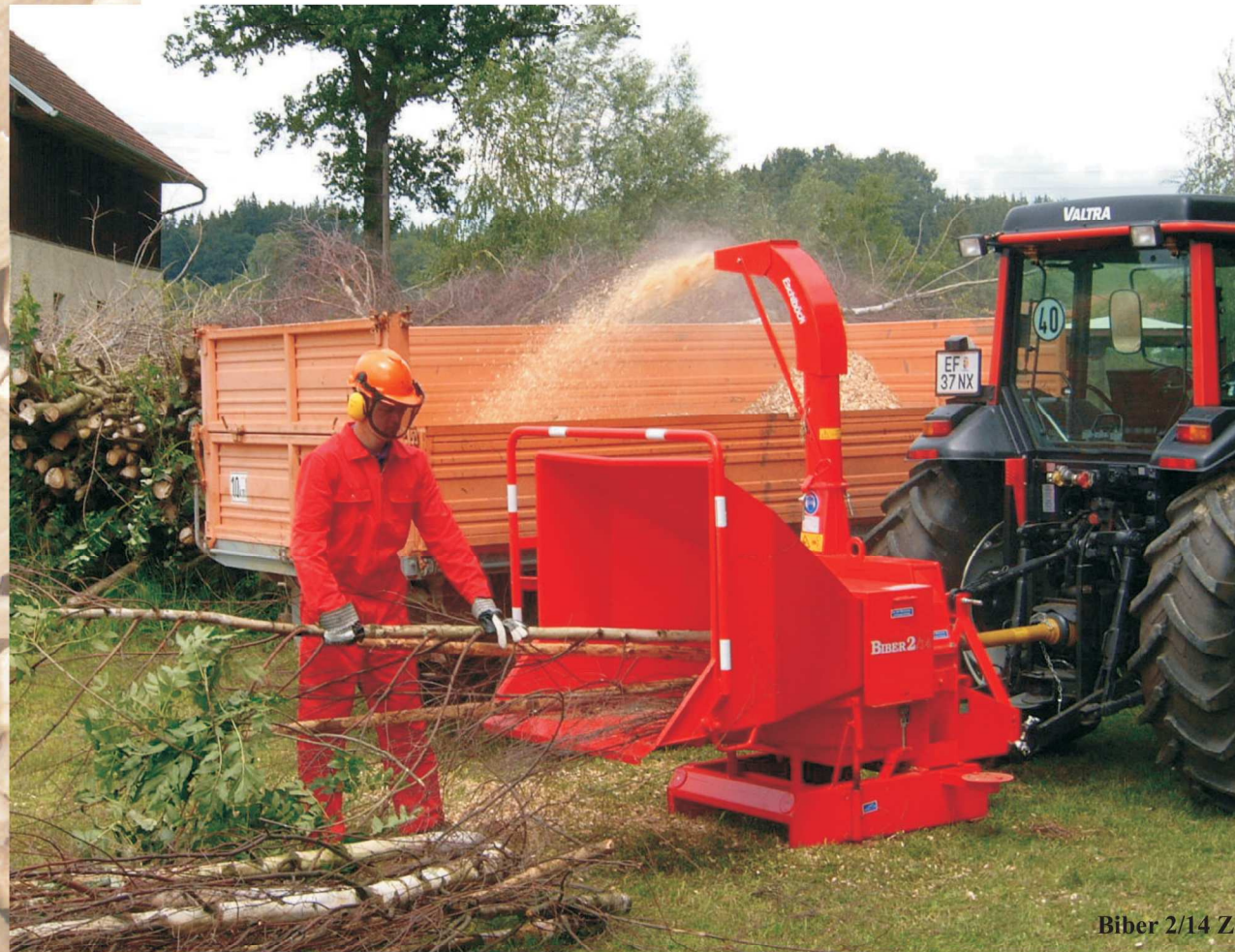
Biber 2/14 Z