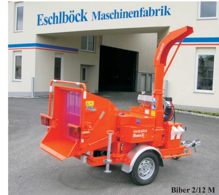
Biber 2/12 M

Nagy teljesítményű faaprítógép Hatz-Silent dízelmotorral.