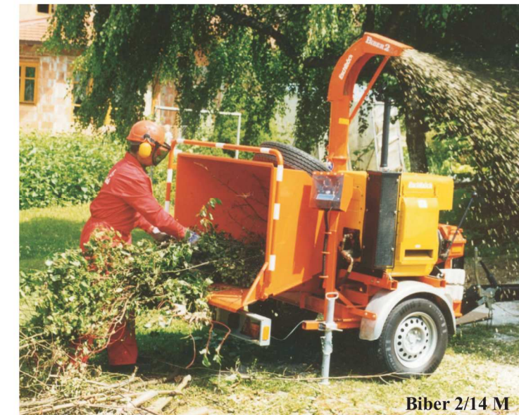
Biber 2/14 M