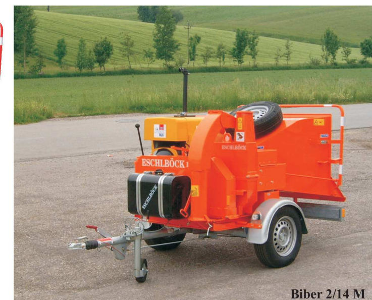
Biber 2/14 M