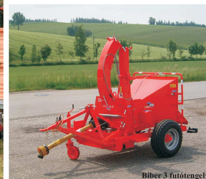
Biber 3 futótengely