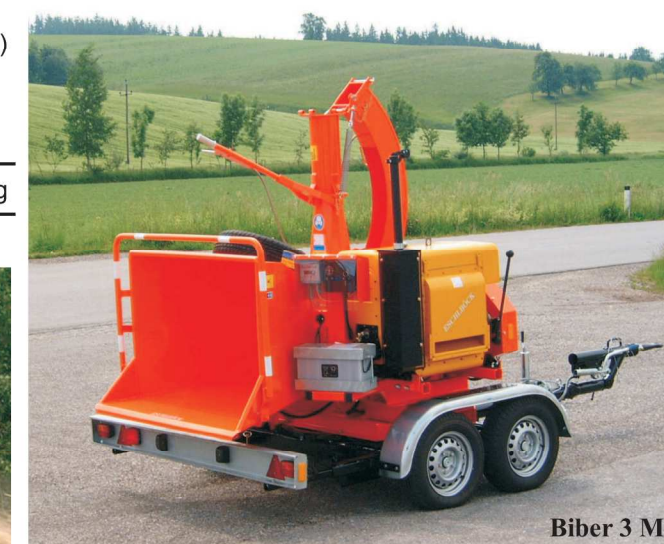
Biber 3 M