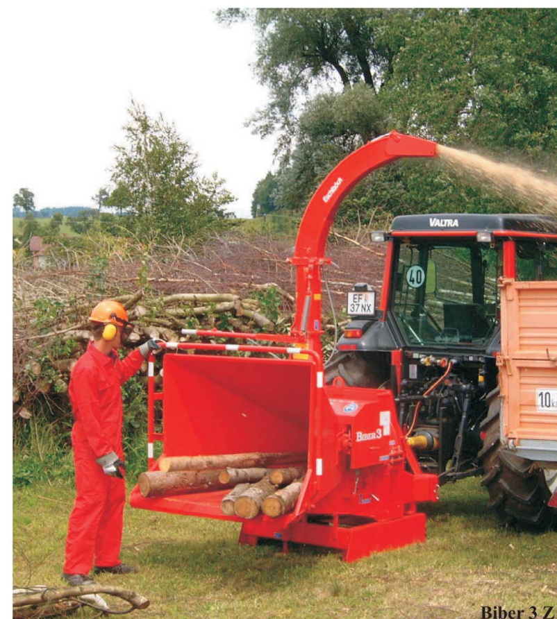
Biber 3 Z