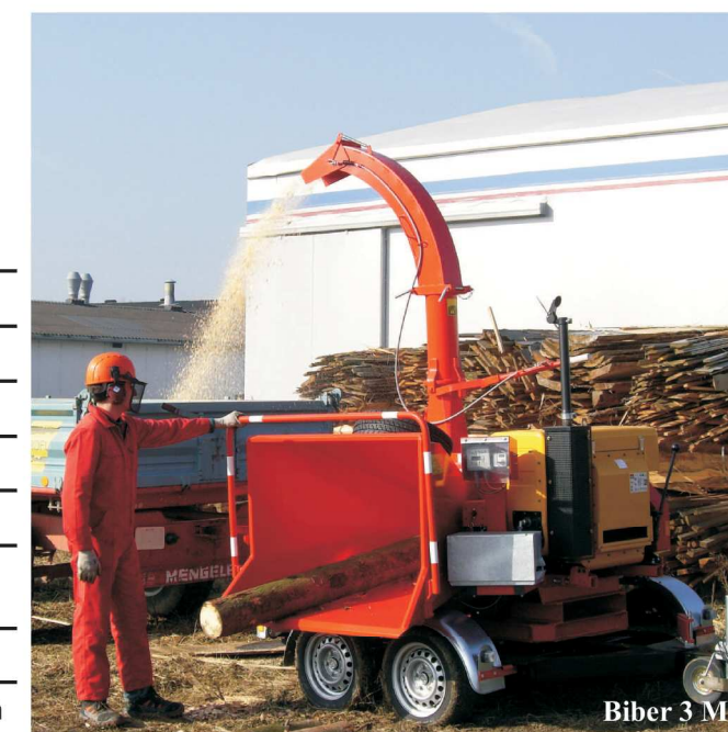
Biber 3 M

* A felszereltségtől függő ○ Kiegészítő felszerelés felár ellenében