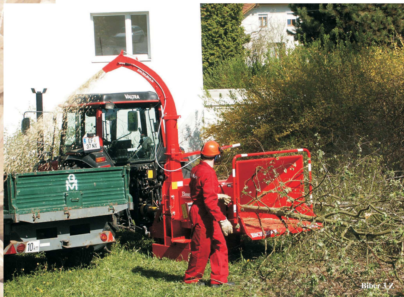
Biber 3 Z