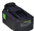
Akkumulátor (5,2 Ah) PT-AKM000086