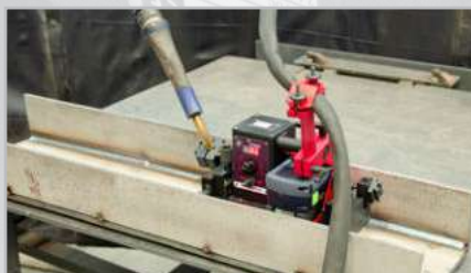
Hegesztés az alkatrészek egyik szélétől a másik széléig