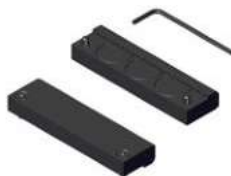
Kiegészítő tapadómágnesek PT-ZST06550900000