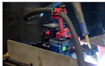
Torch placement on either side