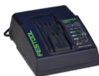
Akkumulátortöltő PT-LDW000006 (220–240 V, 50/60 Hz) PT-LDW000007 (120 V, 60 Hz)