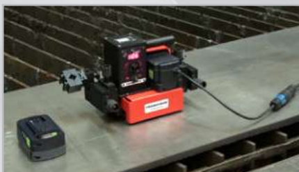
Opcionális 110-240 V-os tápegység