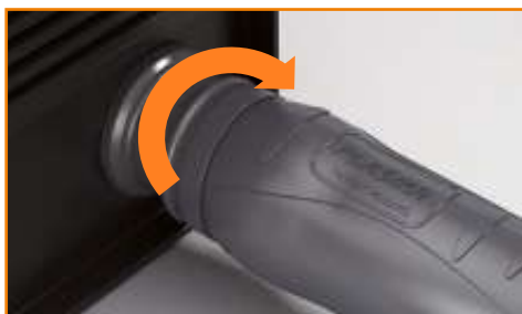
A vágópisztoly csatlakoztatása