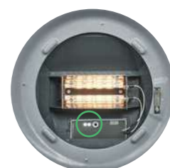
PILOT LIGHT WITH INFRARED SENSOR

Ez az infralámpa infravörös technológiával rendelkezik. A lámpa a felületi hőmérséklet mérésével optimális hőmérsékletet tart a búvóláda alatt. Mobil applikációval és hőmérsékleti görbe megadásával szabályozható. Szabályzó mágnes és NFC lehetőséggel rendelkezik.