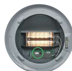
PILOT LIGHT WITH INFRARED SENSOR

Infralámpa beépített infravörös vezérléssel és opcionális FarmViewer kezelési funkciókkal, távirányítóval és online szolgáltatással rendelkezik