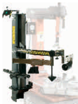
A fotón KIT BPS opcióval